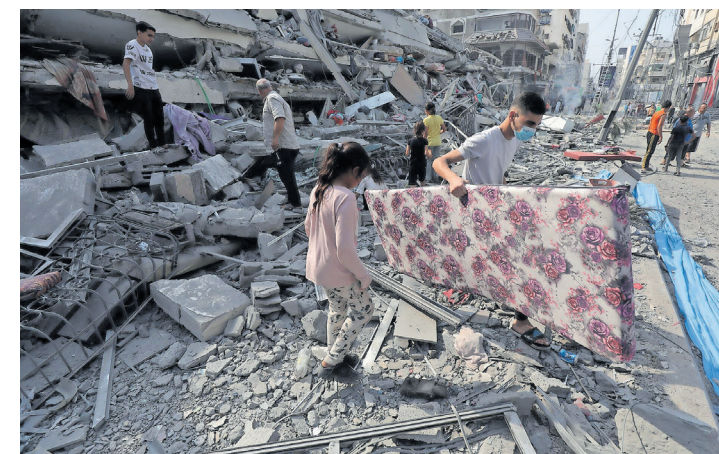
▲ 8. Oktober 2023: Palästinenser inspizieren die Ruinen des Aklouk-Turms, der bei israelischen Luftangriffen in Gaza-Stadt zerstört wurde.

Auch bei einer erweiterten Zweistaatenlösung wäre ein Friedensschluss schwierig. Für Israels Nationalreligiöse ist das Alte Testament mit dem Gelobten Land die politische Leitlinie, für die Palästinenser ist es der aus dem Koran abgeleitete Anspruch auf Jerusalem. Heiliges lässt selbst im Heiligen Land Kompromisse schwerlich zu. Es ist daher leider davon auszugehen, dass die Kriege weitergehen werden.