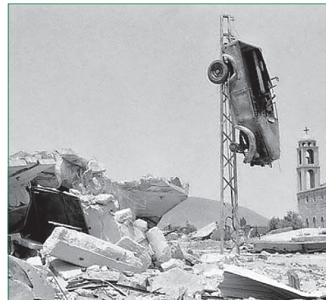
▲ Jom-Kippur-Krieg Oktober 1967: Zerstörungen in der syrischen Stadt Quneitra auf den Golanhöhen